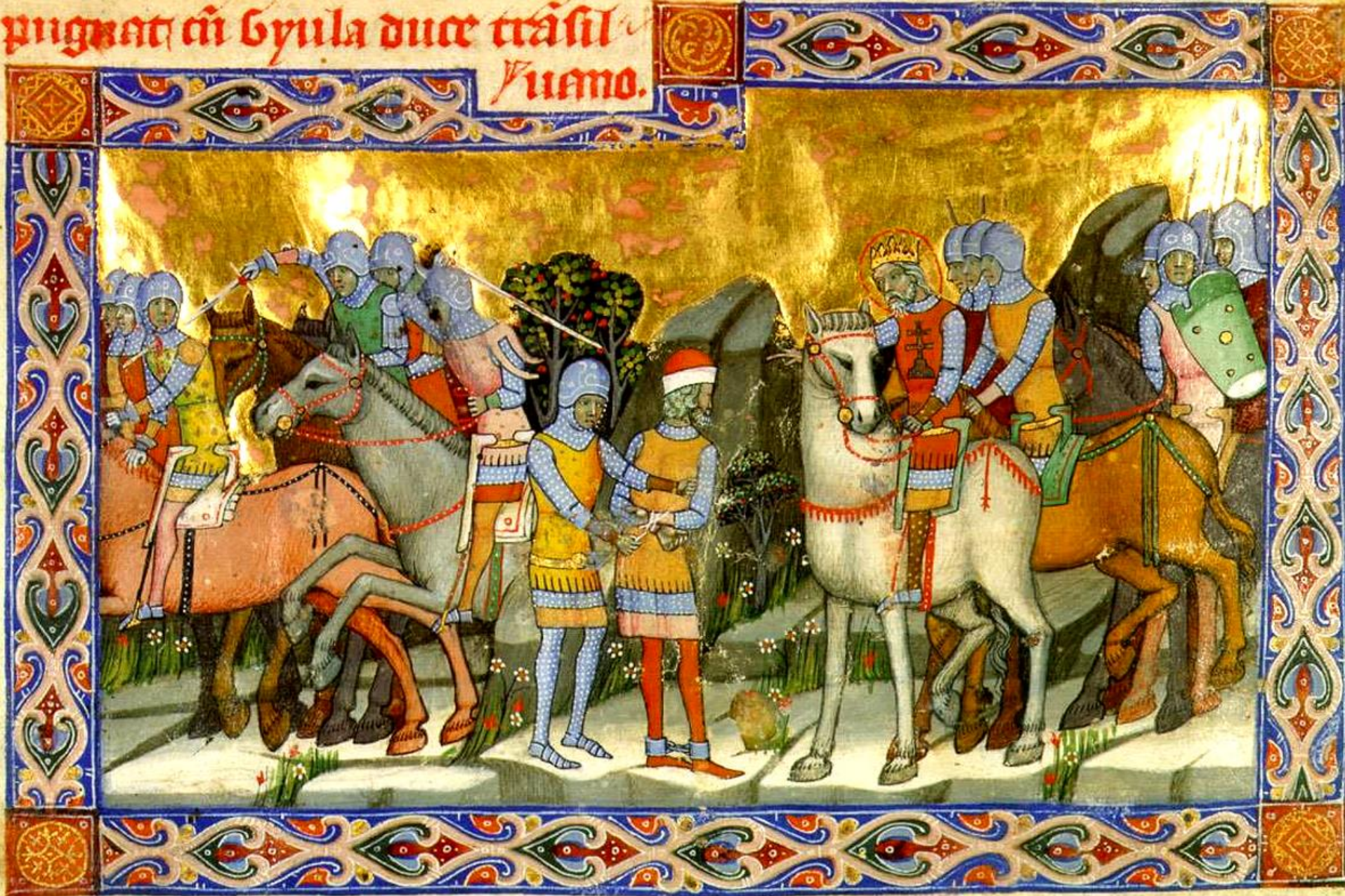
Cronica pictată de la Viena : regele Ștefan îl capturează în 1003 pe Gyula cel Tânăr