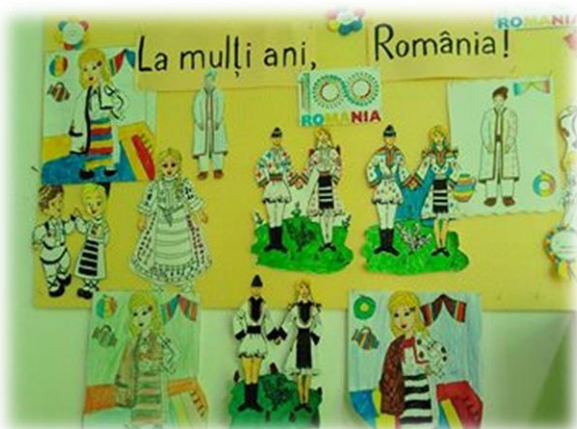
Desne ale elevilor clasei I B